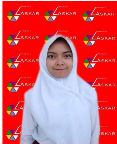
Contoh peserta PKKMB Yang menggunakan Kerudung