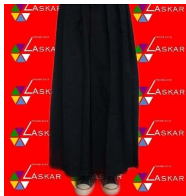
Contoh seragam bawahan peserta PKKMB Perempuan (rok)