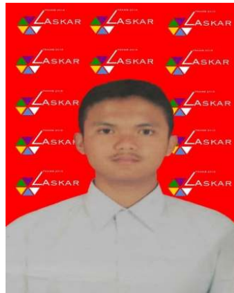
Contoh potongan rambut Peserta PKKMB Laki-laki