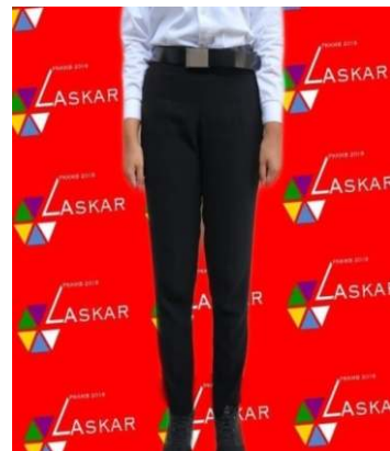
contoh baju dan celana peserta PKKMB Laki-laki