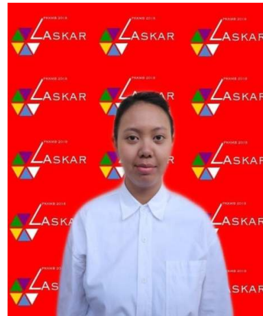
Contoh peserta PKKMB yang tidak menggunakan kerudung