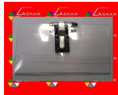
Contoh untuk Name tag