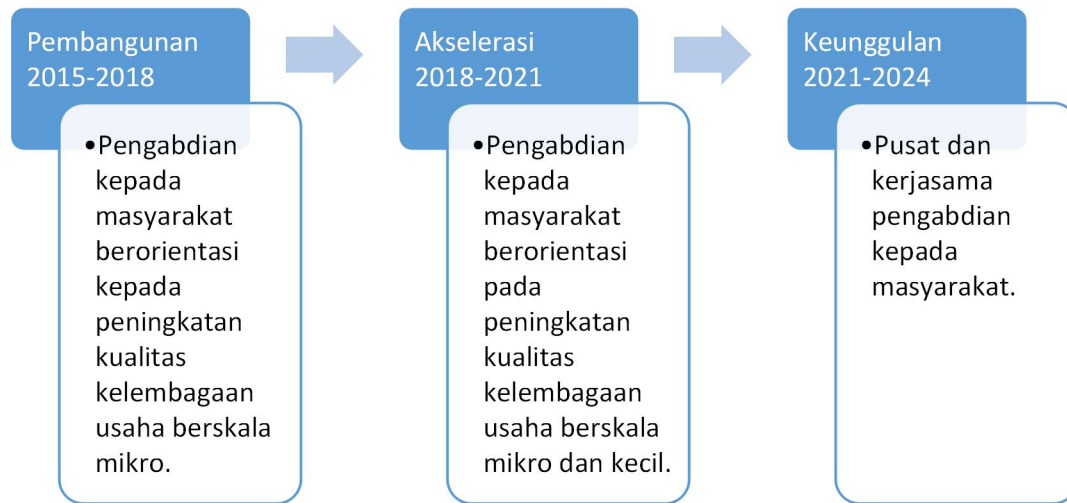
Gambar1. Longterm roadmap pengabdian kepada masyarakat