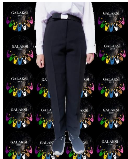
Contoh baju dan celana Peserta PKKMB Laki-laki