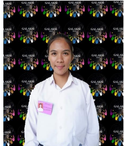
Contoh peserta PKKMB yang tidak menggunakan kerudung