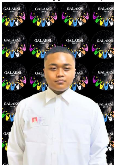
Contoh potongan rambut Peserta PKKMB Laki-laki