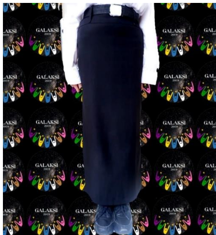
Contoh seragam bawahan peserta PKKMB Perempuan (rok)