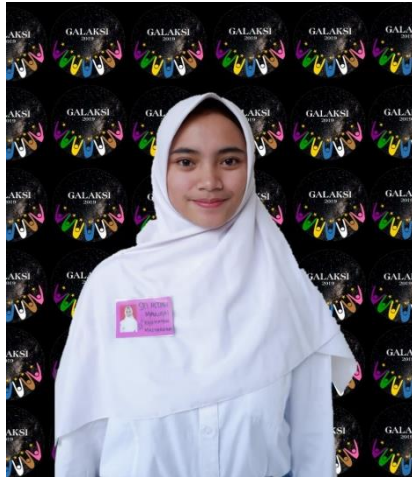
Contoh peserta PKKMB yang menggunakan Kerudung