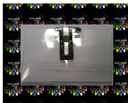
Contoh untuk Name tag