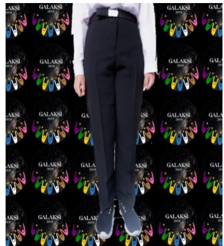
Contoh seragam bawahan peserta PKKMB perempuan (celana)